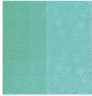
FMM Tapis d'Impression Dentelle Vintage set/2