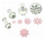
PME Emporte-pièce Pousoir Marguerite set/4