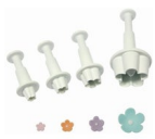
PME Emporte-pièce Pousoir Fleur Blossom set/4