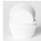
House of Marie Baking Cups Blanc pk/48