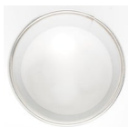
Emporte-pièce Anneau Pro Ø7cm